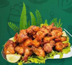
Frango a Passarinho