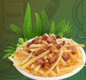
Batata Frita C/ Bacon